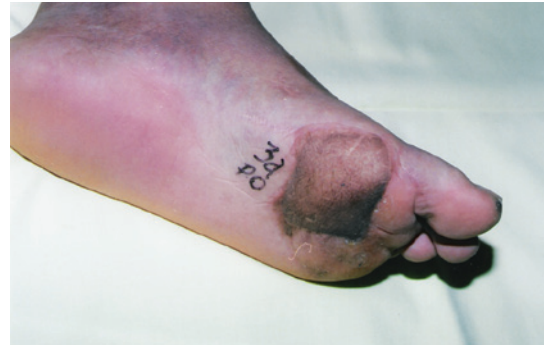
Figura 1 – Região plantar, contato de saída da corrente elétrica, coberta com retalho lateral do braço: pós-operatório de três anos.

Na cabeça e no pescoço, os grandes desafios têm sido a cobertura de extensas perdas de couro cabeludo e de calota