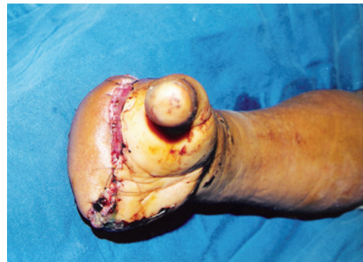
Figura 3 – Cobertura com retalho lateral do braço, após amputação transmetacarpiana em paciente vítima de queimadura elétrica.

As sequelas funcionais decorrentes de queimaduras no membro inferior são menos frequentes, porém as retrações em fossa poplíteia, região dorsal do pé, pododáctilo e tornozelos acarretam graves deficiências funcionais do membro, limitando a deambulação e o desenvolvimento músculo-esquelético. Nessas regiões, os procedimentos convencionais, zetaplastia, enxertias e retalhos locais, têm resolvido a maioria das retrações. Os desafios recaem nas regiões em que a cobertura plantar e a limitação articular estejam presentes, decorrentes ou não de tratamentos convencionais. Nas coberturas articulares do tornozelo, damos preferência ao retalho muscular do gracilis; em perdas extensas do dorso do pé e terço médio-inferior da perna, damos preferência ao retalho do grande dorsal, principalmente se há exposições ou perdas ósseas. A Figura 4 demonstra a cobertura de área com extensa perda de substância em dorso de pé e tornozelo, com exposição óssea articular.