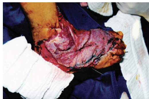
Figura 4 – Cobertura do dorso do pé e tornozelo com retalho do músculo grande dorsal.