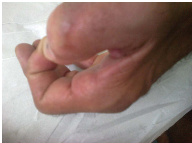
Figura 2. Pós-operatório tardio, cicatriz satisfatória e sem impotência funcional.

Não se evidenciou deiscência da ferida, infecção e seroma (Figura 2). O tempo de fechamento da ferida foi de quinze dias após a retirada da sutura elástica e síntese convencional da ferida com Nylon 3-0.