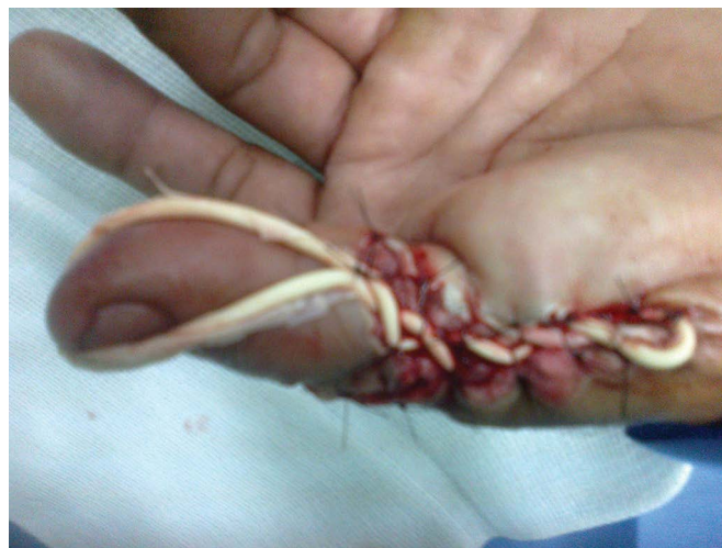
Figura 1. Aspecto pós-operatório da sutura elástica.

O tratamento cirúrgico realizado foi a sutura elástica da ferida, esta permanecendo por uma semana. Realizou-se bloqueio anestésico do 1º QDE, reconstrução com sutura elástica da ferida dorsal do 1º QDE, com material elástico da empunhadura de luva estéril, sendo fixado às bordas da ferida por meio de pontos de Nylon calibre 3-0, com distância de cerca de 0,5 cm entre os pontos, no Centro Cirúrgico (Figura 1). A força de compressão realizada foi adequada para aproximação da ferida. O comprimento do segmento de borracha é o da empunhadura de luva estéril número 8,5 no caso em questão, possibilitando a aproximação completa da ferida.