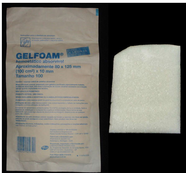
Figura 1. Dispositivo hemostático de esponja gelatinosa absorvível GELFOAM®.