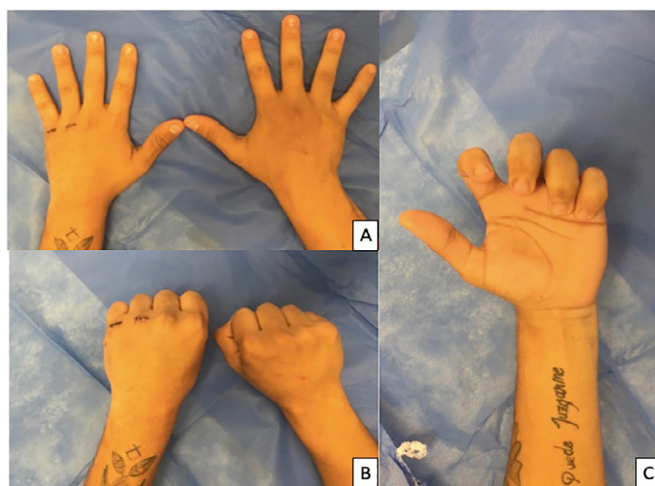
Figura 4. Caso 1. Quinto dia pós-operatório. A: Extensão total; B: Flexão total; C: Bom alinhamento.

determinado, há evidências tomográficas que, em alguns dos casos, a ossificação direta é alcançada 4 .