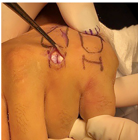
Figura 1. Abordagem da pele foi transversal no dorso da articulação metacarpofalângica e tenotomia limitada longitudinalmente.

A abordagem da pele foi transversal no dorso da articulação metacarpofalângica e foram realizadas tenotomia e capsulotomia limitada longitudinalmente (Figura 1).