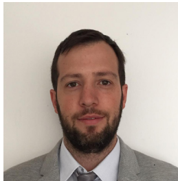
CAMILO PREGO 1*

Cannulated compression screws without intramedullary heads for treatment of metacarpal fractures: experience at University Hospital