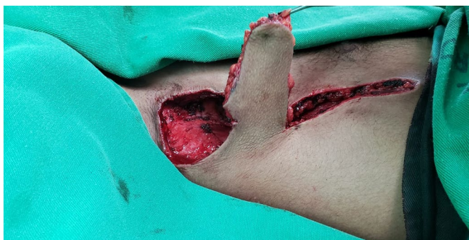
Figura 2. Procedimento cirúrgico com ressecção total ampla da hidradenite em MSD, região axilar e rotação do retalho fasciocutâneo torácico lateral anterior.