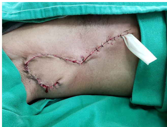
Figura 4. Procedimento cirúrgico finalizado, com sutura finalizada e dreno penrose posicionado.