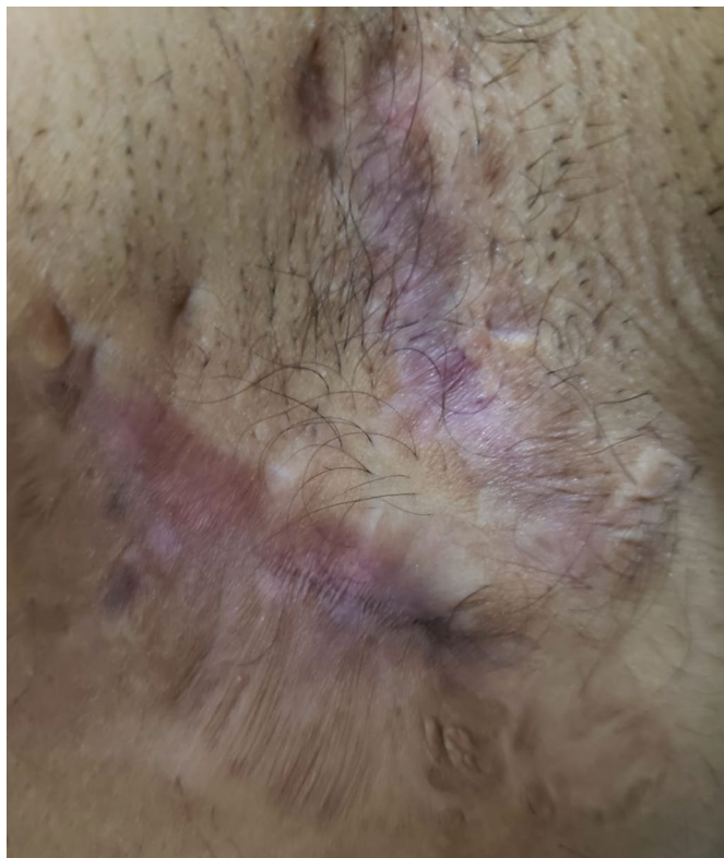
Figura 1. Axila direita com presença de cicatrizes e lesões da hidradenite.