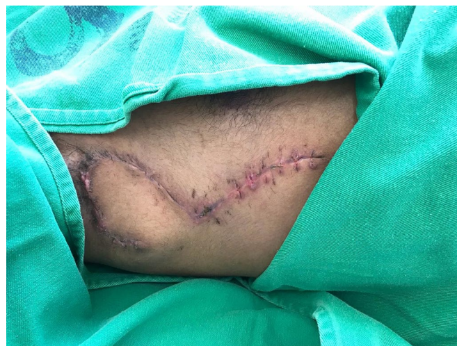
Figura 5. Aspecto da incisão cirúrgica no 15º pós-operatório (PO).