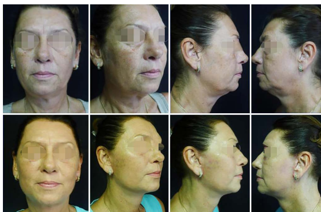
Figura 6. Pós-operatório de 2 meses e 1 ano.

Os resultados parciais são vistos logo nas primeiras semanas, principalmente após a drenagem linfática. Após um mês não se observa mais edema. A longo prazo, a cirurgia pode ser refeita em torno de 5 a 7 anos, e como não altera a implantação pilosa, ela pode ser feita várias vezes ao longo dos anos sem deixar estigmas, como visto em pós-operatórios de 1 ano (Figuras 6 e 7). As complicações foram bem menores, onde os raros hematomas se restringiram a pequenas regiões drenadas por punção transcutânea com 7 dias (12 casos). A queixa principal é a persistência em idosos e pacientes pós-bariátricos de alguma pele na região cervical central.