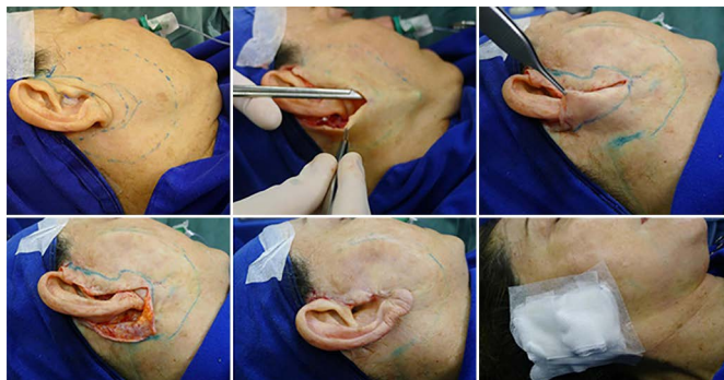
Figura 5. Marcação, descolamento, pontos de adesão, excesso de pele, sutura e curativo.