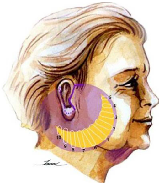
Figura 3. Pontos de plicatura do SMAS, com direção de tração. A ordem da sutura começando pelo ângulo da mandíbula.