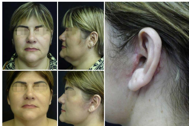
Figura 7. Pós-operatório com detalhe na região retroauricular.

O rejuvenescimento facial deve englobar diversas formas complementares de tratamento e atuar de maneira eficaz em todas as regiões faciais. O arsenal cosmético em ascensão, com os preenchedores somados à toxina botulínica estão colocando em discussão o lifting coronal amplo, sobretudo em pacientes mais jovens. Em indivíduos mais velhos, entender a interação entre essas