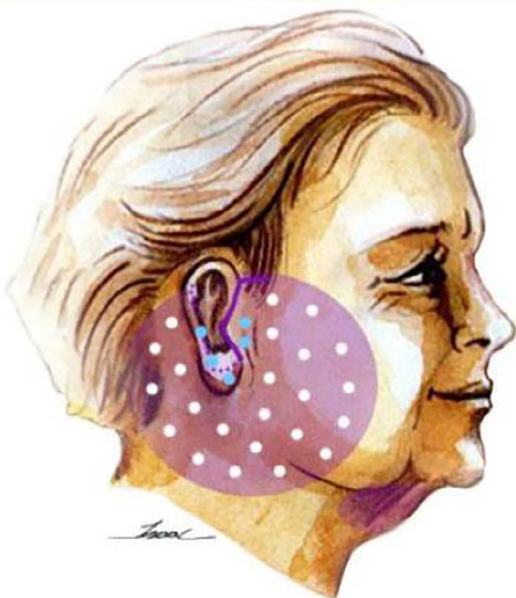
Figura 4. Pontos de adesão. Pontos com monocryl 4.0 (em branco) e mononylon incolor 4.0 (em azul).

período de 2014 a 2020, dos quais 39 eram homens. Pacientes com idade entre 31 e 84 anos (com a média de 56 anos). Todos os pacientes foram operados e observados pelo mesmo cirurgião e autor deste trabalho (2014 - 24, 2015 - 35, 2016 - 33, 2017 - 42, 2018 - 51, 2019 - 80, 2020 - 19).