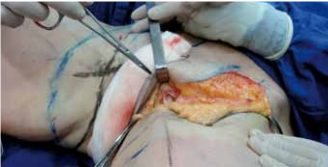
Figura 8 – Detalhe intra-operatório da primeira ancoragem.