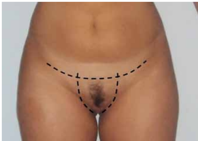
Figura 3 – Marcação na região da virilha.

• Lipoaspiração: Quando necessária, a lipoaspiração é realizada como primeiro passo. Após infiltração de solução de Klein, lipoaspiramos a camada profunda próxima à