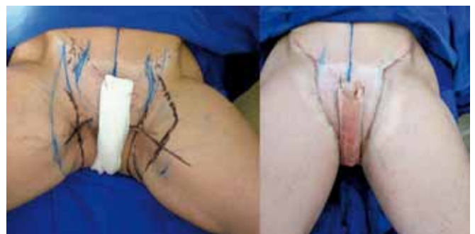
Figura 15 – Aspecto comparativo da cirurgia finalizada em membro inferior esquerdo.