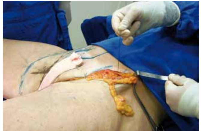
Figura 12 – Detalhe intra-operatório da segunda ancoragem.