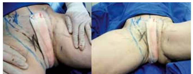
Figura 14 – Aspecto comparativo da cirurgia finalizada em membro inferior esquerdo.