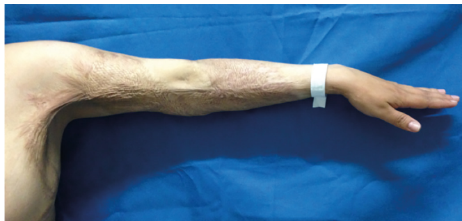
Figura 4. Caso clínico 2. Foi solicitado ao paciente que realizasse a abdução do braço esquerdo. Nota-se limitação da movimentação do membro.