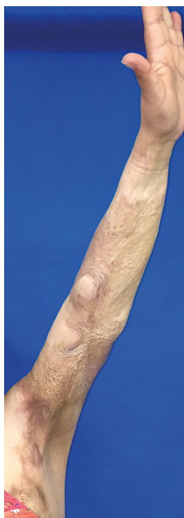
Figura 5. Pós-operatório caso 2. Pós-operatório de 1 ano evidenciando boa recuperação funcional com extensão completa do membro superior.

triangulares com o objetivo de modificar o eixo da cicatriz final. Os retalhos das zetaplastias frequentemente têm ângulo de 60° entre si, determinando um alongamento da cicatriz em 75%.