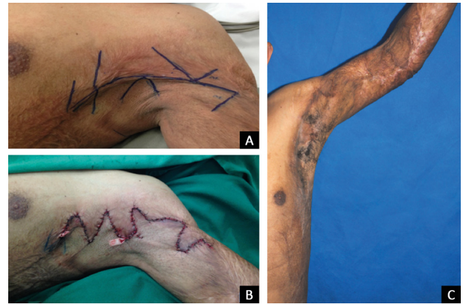
Figura 3. Pré e pós-operatório. A: Marcação pré-operatória; B: Pós-operatório imediato; C: 1 ano de pós-operatório. Observa-se liberação das bridas e restauração da amplitude de movimento.

superior esquerdo com tala gessada até o quinto dia pós-operatório. A evolução do caso foi satisfatória, com liberação das bridas e restauração da amplitude de movimento do membro superior no pós-operatório (Figura 3).