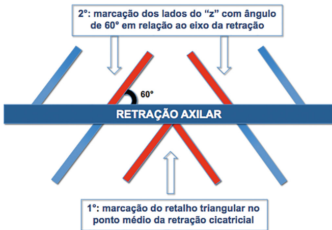
Figura 1. Tática de marcação de zetaplastia múltipla. Marcamos primeiramente o retalho que vai cruzar o eixo da retração cicatricial e que se localiza no ponto médio desta. A partir dessa marcação planejamos os demais lados da zetaplastia.

O número de zetaplastias necessárias dependerá do tamanho da retração e da amplitude de movimento que se deseja obter. Tais retalhos são planejados subsequentemente, a partir da marcação do retalho inicial localizado no ponto médio da retração, facilitando a marcação dos demais ramos da zetaplastia (Figura 1).